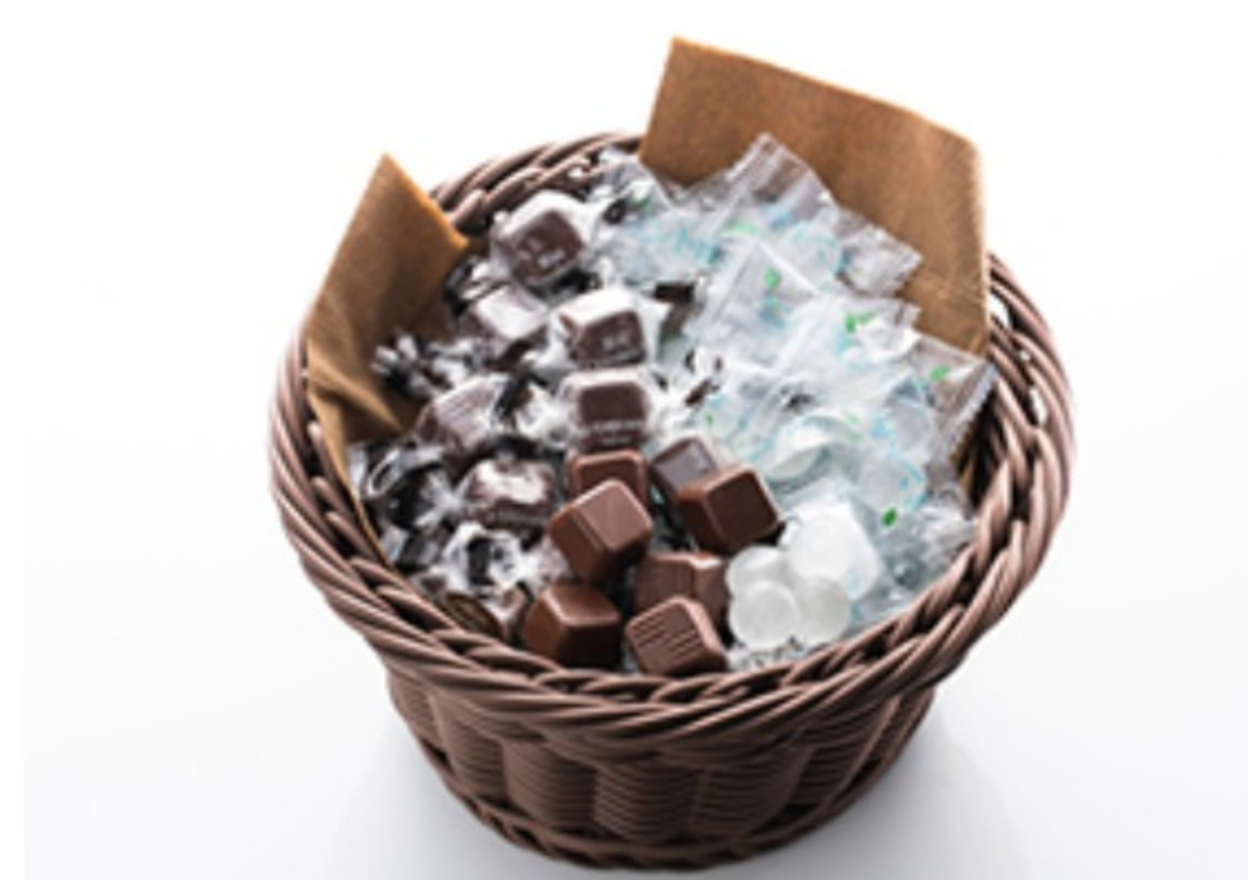
リフレッシュメント ¥1,000 （チョコレート30個・ミントキャンディ30個）