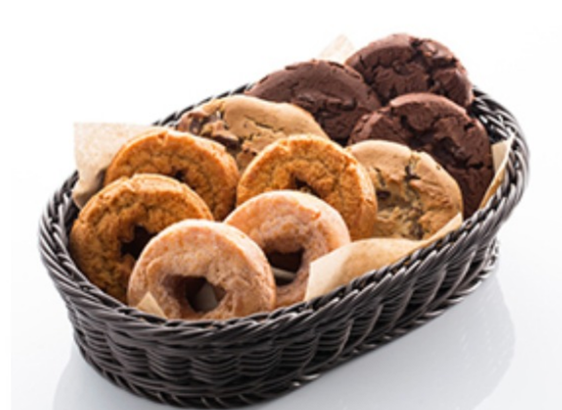
スイーツバスケットA ¥1,700 （ドーナツ5個・クッキー5個）