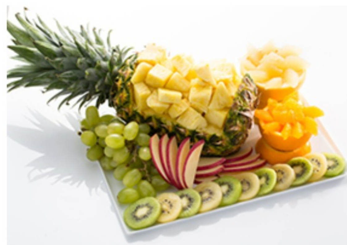
カットフルーツ盛り合わせ ¥12,000～